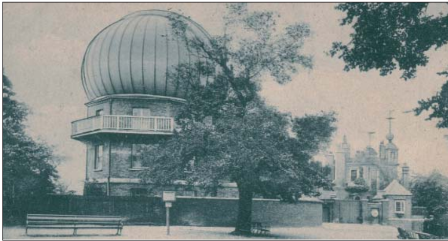
Королівська астрономічна обсерваторія в Гринвічі. Фото початку ХХ ст.

торії, а саме, обсерваторії Парижа, Берліна, Гринвіча та Вашингтона.