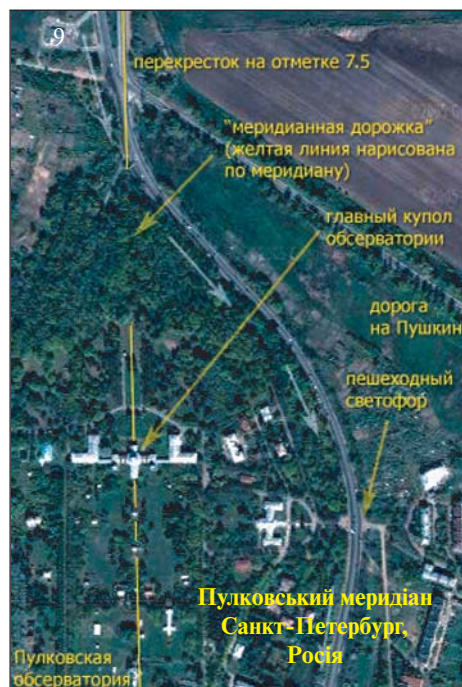
Пулковський меридіан Санкт-Петербург, Росія