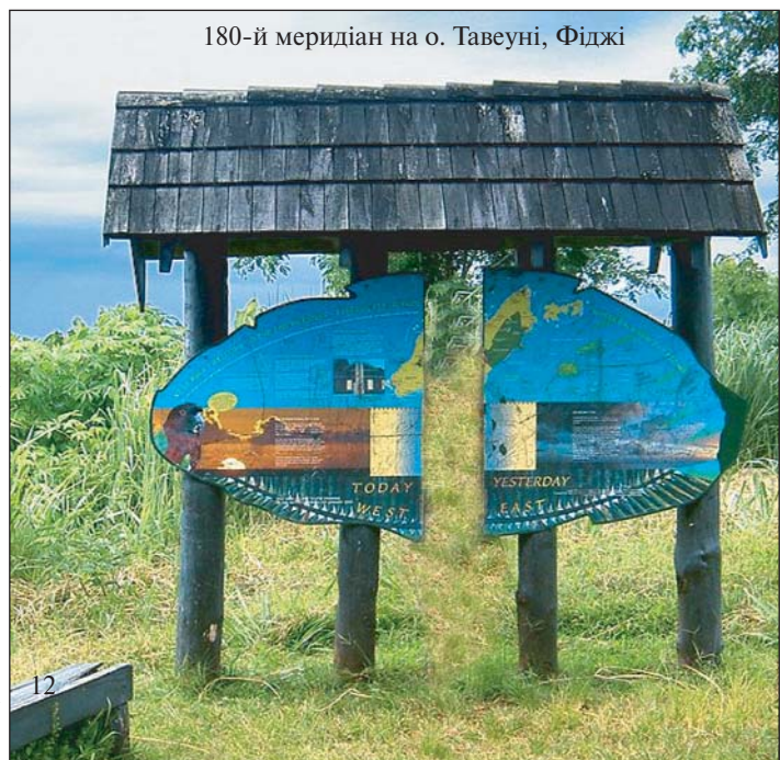
180-ий меридіан на о. Тавеуні, Фіджі