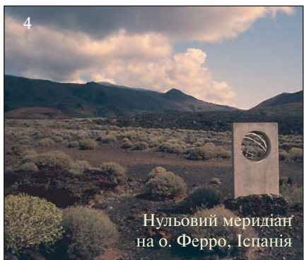
Нульовий меридіан на о. Ферро, Іспанія

Але й сьогодні в багатьох містах світу відмічені пам'ятними стелами, скульптурними групами, медальйонами на бруківці, сталевими стрічками, назвами вулиць та навіть палаців, на стінах будівель і на підлогах середньовічних храмів численні меридіани з назвами тих місць, де були точно визначені переважно астрономічними методами точні координати на Землі.