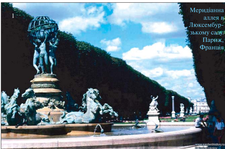
Меридіанна аллея в Люксембурзькому саду, Париж, Франція

У 1792 р. Національне зібрання Франції доручило астрономам Жану Батисту Деламбру (1749-1822) та П'єру Франсуа Андре Мешену (1744-1804) “виміряти Землю” — провести польові роботи з вимірювання паризького меридіана між іспанською Барселеною та французьким Дюнкирхеном. Цю “геркулесову задачу” в умовах французької революції астрономи вирішували 6 років. Як результат їхньої роботи у грудні 1799 р. був відлитий перший еталон метра — одну десятиміліонну частину (1/10000000) цього меридіанного квадранта по поверхні земного еліпсоїда на довготі Парижа вирішено було прийняти за “еталон довжини для всіх часів і народів”. Паризький меридіан позначено на підлозі будівлі обсерваторії, де він і був визначений,