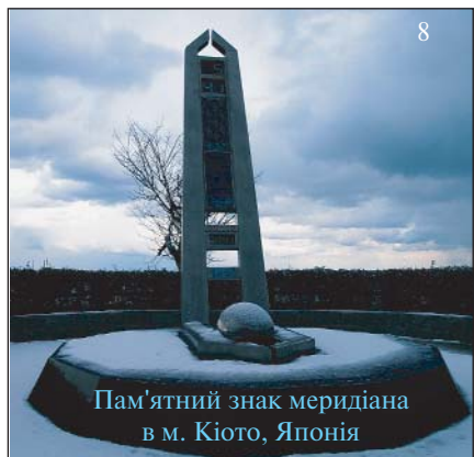
Пам'ятний знак меридіана в м. Кіото, Японія

Має пам'ятний знак, встановлений геодезистами ще у 1736 р., Екватор — перетин тодішнього нульового меридіана з екватором — Mitad Del Mundo — Середина світу. В норвезькому місті Хаммерфесті стоїть знаменита Колонна меридіанів як пам'ять про спробу визначити точну форму і розміри земної кулі. Має свій меридіанний монумент і японське місто Кіото [8].