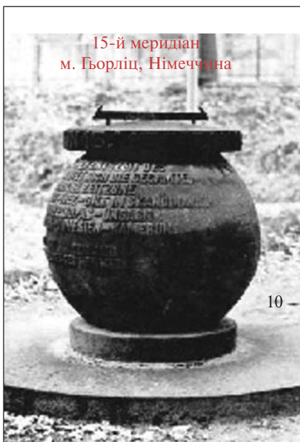
15-й меридіан м. Гьорліц, Німеччина