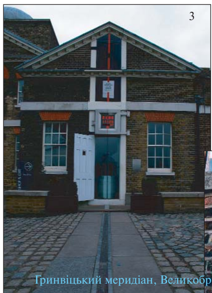
Гринвіцький меридіан, Великобританія

Має пам'ятний знак, встановлений геодезистами ще у 1736 р., Екватор — перетин тодішнього нульового меридіана з екватором — Mitad Del Mundo — Середина світу. В норвезькому місті Хаммерфесті стоїть знаменита Колонна меридіанів як пам'ять про спробу визначити точну форму і розміри земної кулі. Має свій меридіанний монумент і японське місто Кіото [8].