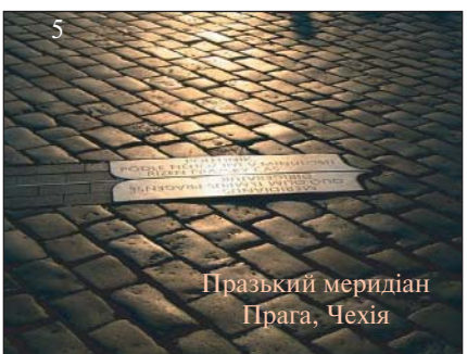
Прагський меридіан Прага, Чехія

Стоїть спеціальний пам'ятний знак на знаменитому меридіані Ферро , а кожен, хто перетинає його, навіть отримує спеціальний сертифікат [4].