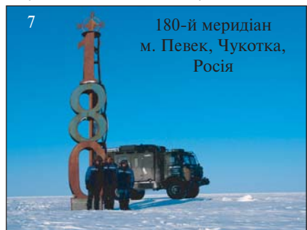
180-й меридіан м. Певек, Чукотка, Росія

цював у 1599 р. відомий данський астроном Тихо Браге . Там він визначив для спостережень меридіан, позначку його знайшли під час реставрації замку, і тепер бенатський меридіан зберігається у вигляді тонкої сталевієї смуги в одній із зал замку.