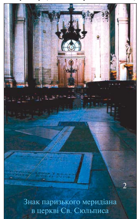
Знак паризького меридіана в церкві Св. Сюльпіса